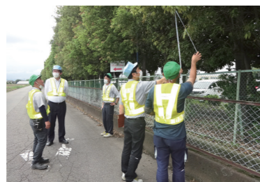
工場周辺環境リスクパトロールの様子

地域社会との交流を深めるために、福祉施設の皆様との交流会や工場周辺の環境リスクパトロール、ボランティア活動、地域イベントへの参加などを行っています。