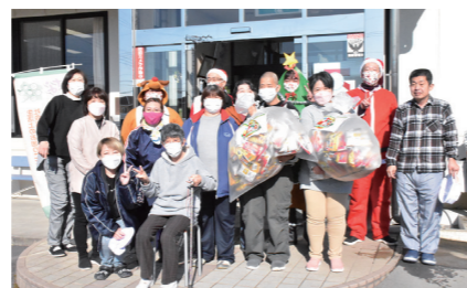
福祉施設クリスマス訪問の様子